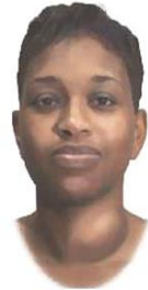
پرکاری تیروئید (گواتر)